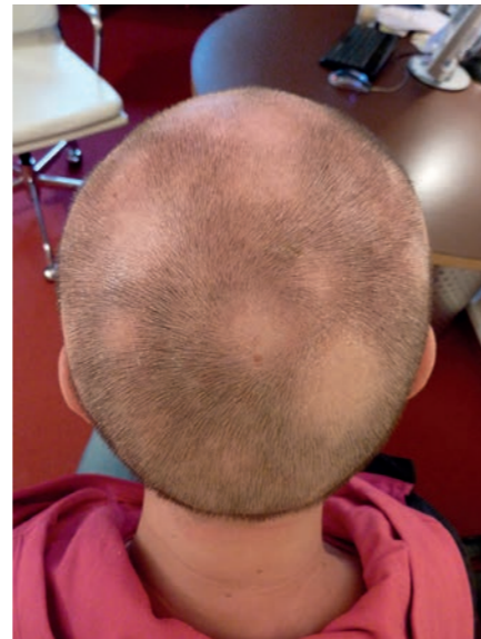
Abbildung 1: Woche 20: Ausgeprägte Alopecia areata und Effluvium

Zu Woche 13, eine Woche nach Absetzen von Telaprevir, kommt die Patientin zur Besprechung. HCV-RNA ist nicht nachweisbar und alle anderen Laborwerte sind nicht gravierend verändert. Der Hautbefund hat sich verschlechtert. Das gesamte Integument erscheint leicht geschwollen, gerötet, lichenifiziert und klein-schuppig belegt. Es besteht eine beidseitige Cheilitis sowie Rhagaden im